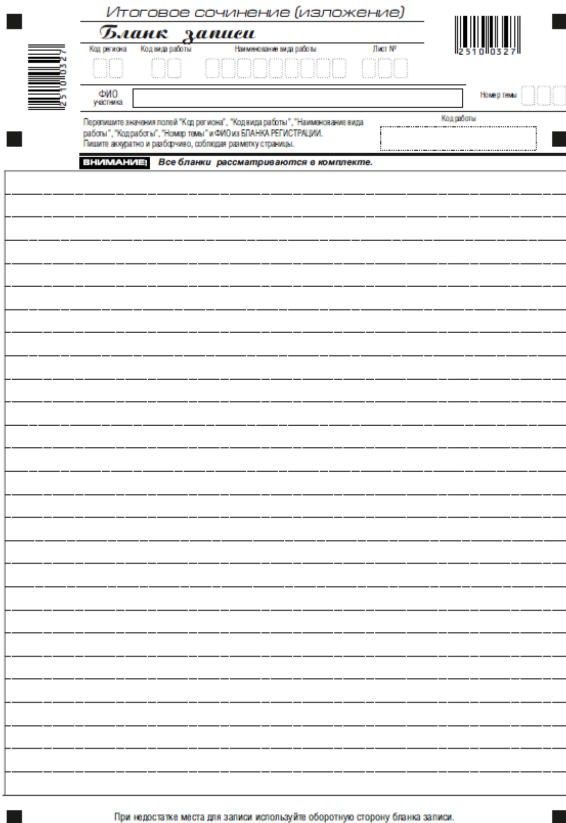
Рис. 5. Бланк записи

В случае использования двустороннего бланка записи при недостатке места для ответов на лицевой стороне бланка записи участник может продолжить записи на оборотной стороне бланка (рис. 6), сделав внизу лицевой стороны запись «смотри на обороте».